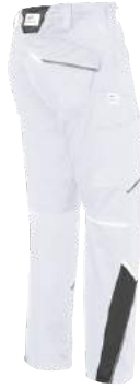
Weiß | Anthrazit 2540 1301-1097 D34 - D54 (inkl. Saumverlängerung um bis zu 5cm)