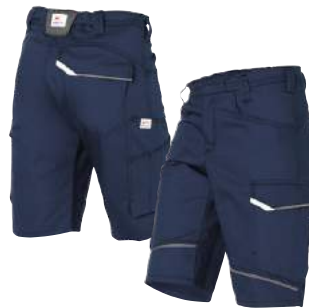
Dunkelblau | Anthrazit 2440 5336-4897 40-66