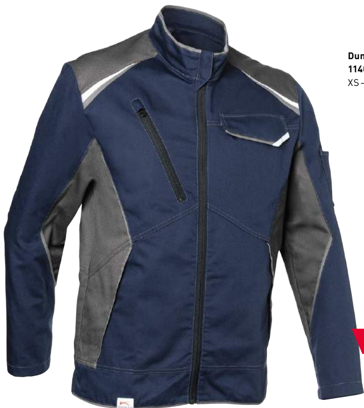
Dunkelblau | Anthrazit 1140 5336-4897 XS - 4XL