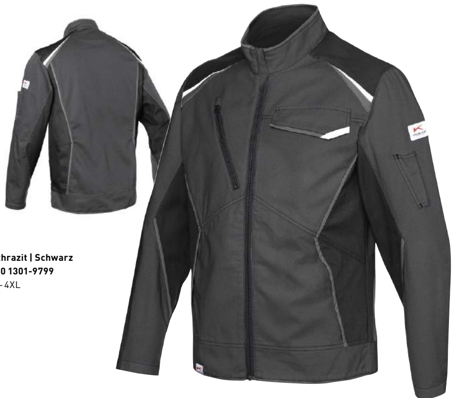
Anthrazit | Schwarz 1140 1301-9799 XS - 4XL