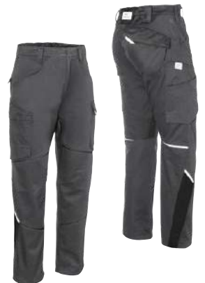
Anthrazit | Schwarz 2540 5336-9799 D34 - D54 (inkl. Saumverlängerung um bis zu 5 cm)