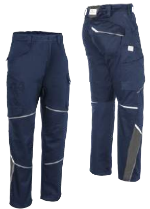
Dunkelblau | Anthrazit 2540 5336-4897 D34 - D54 (inkl. Saumverlänge- rung um bis zu 5 cm)