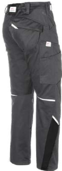
Anthrazit | Schwarz 2540 1301-9799 D34 - D54 (inkl. Saumverlängerung um bis zu 5cm)