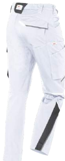
Weiß | Anthrazit 2340 1301-1097 40 – 66 (inkl. Saumverlängerung um bis zu 5 cm)