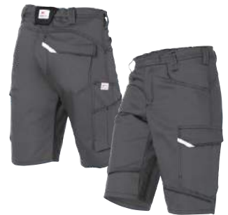
Anthrazit | Schwarz 2440 5336-9799 40-66