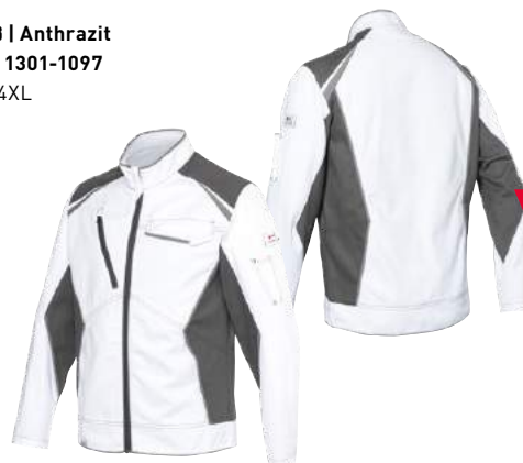
Weiß | Anthrazit 1140 1301-1097 XS - 4XL