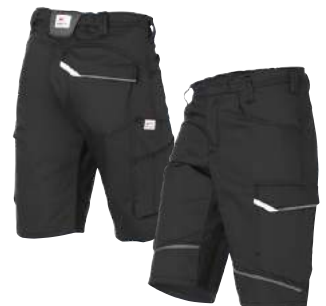
Schwarz | Anthrazit 2440 5336-9997 40-66

AUCH IN WEISS | ANTHRAZIT VERFÜGBAR: SEITE 29