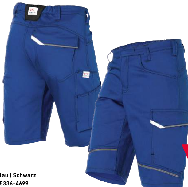
Kbl.blau | Schwarz 2440 5336-4699 40-66