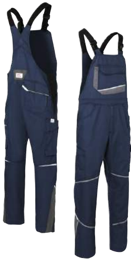
Dunkelblau | Anthrazit 3140 5336-4897 40 – 66 (inkl. Saumverlängerung um bis zu 5 cm)