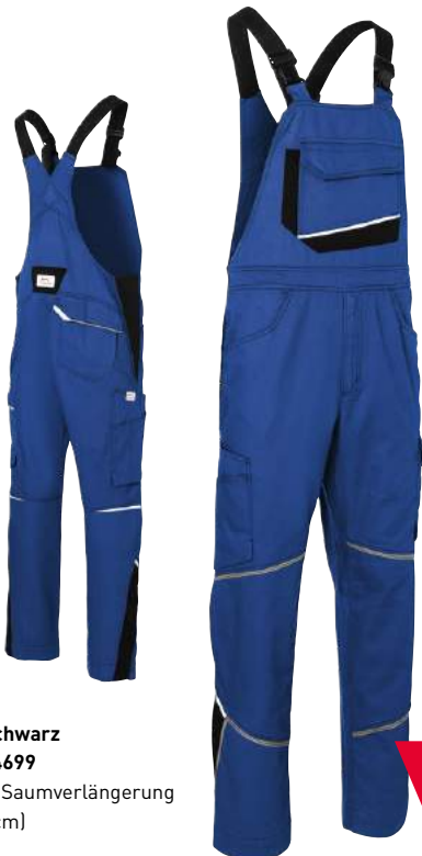
Kbl.blau | Schwarz 3140 5336-4699 40 – 66 (inkl. Saumverlängerung um bis zu 5 cm)