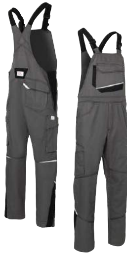
Anthrazit | Schwarz 3140 5336-9799 40 – 66 (inkl. Saumverlängerung um bis zu 5 cm)