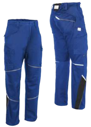
Kbl.blau | Schwarz 2540 5336-4699 D34 - D54 (inkl. Saumverlängerung um bis zu 5 cm)