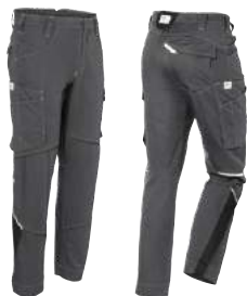
Anthrazit | Schwarz 2340 1301-9799 40 – 66 (inkl. Saumverlängerung um bis zu 5 cm)